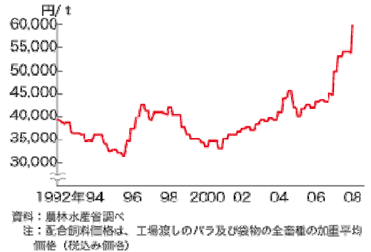
図2-72 配合飼料価格の推移